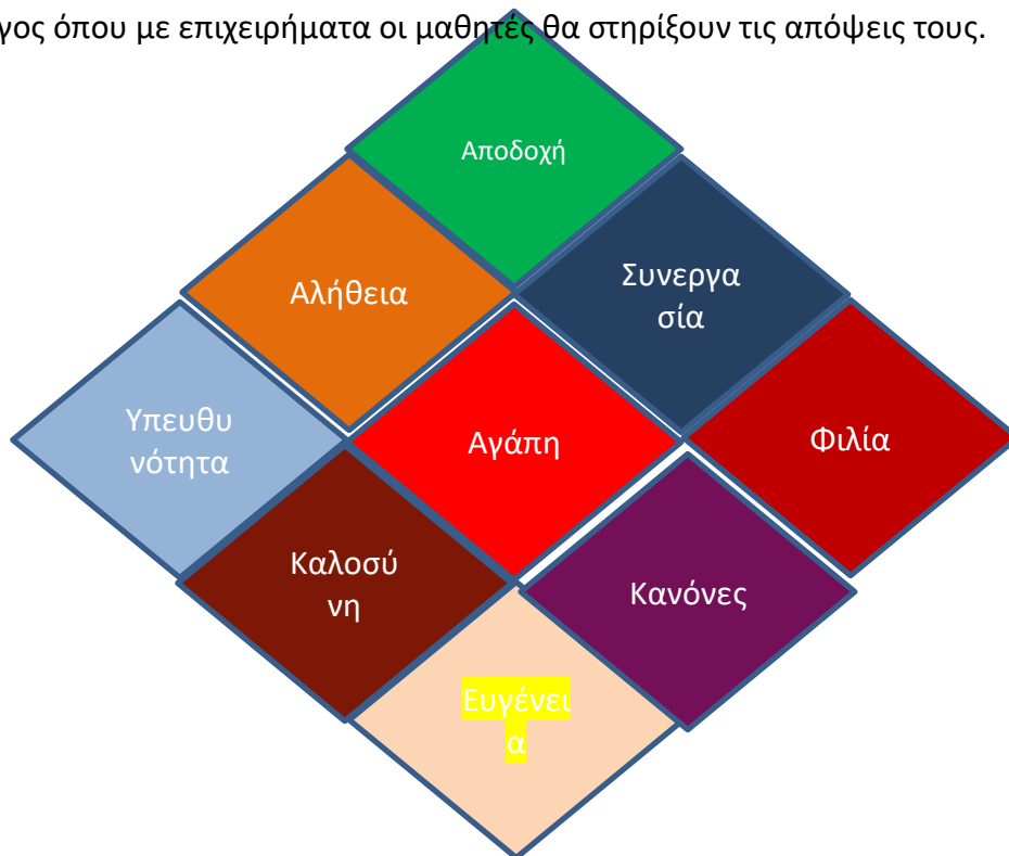
Εικόνα 2: Το διαμάντι του σεβασμού

Δεν υπάρχει σωστή αιτιολόγηση, σημασία έχει να αναπτυχθεί ένας επικοινωνιακός διάλογος όπου με επιχειρήματα οι μαθητές θα στηρίξουν τις απόψεις τους.