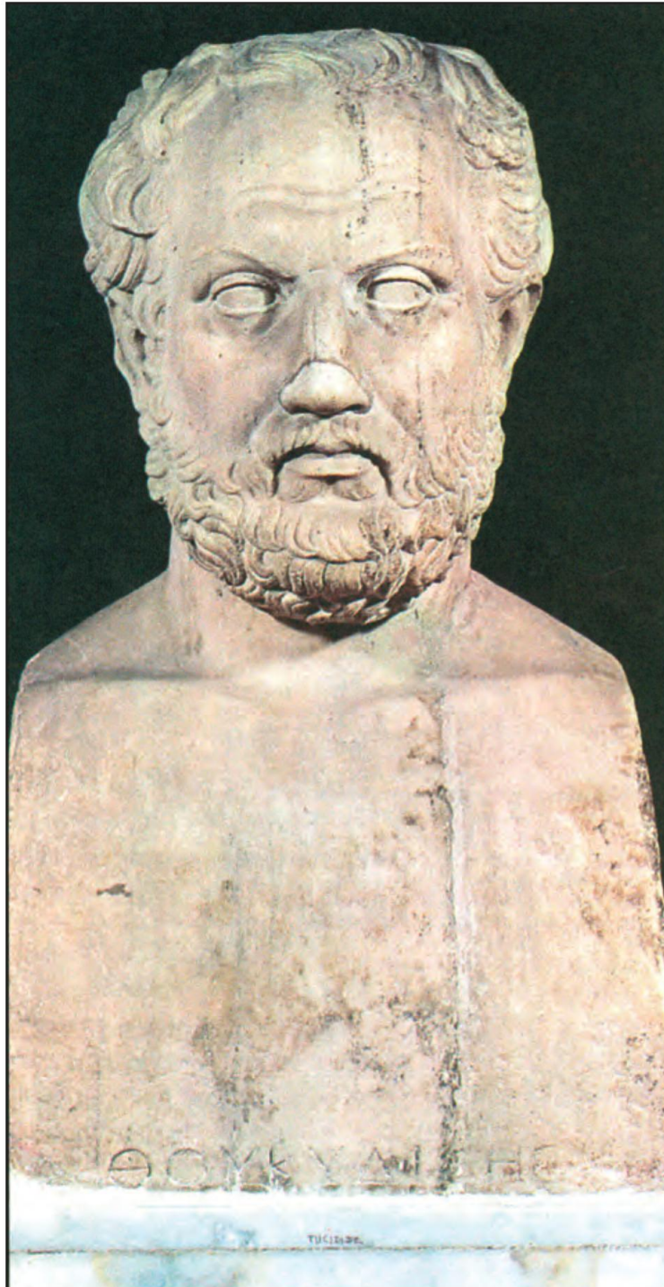
Θουκυδίδης (Εκδοτική Αθηνών)

Μια επιστημονική ιδιοφυΐα, μια μεγάλη ψυχή μορφώθηκε με τη λάμψη και τους προβληματισμούς των μεγάλων τραγικών, με την ανανεωμένη ιατρική του Ιπποκράτη, με την αναθεωρητική ορμή και τη ρητορική δεινότητα του κινήματος των σοφιστών. Έδωσε ένα «κτῆμα ἐς αἰεί», που κάθε άνθρωπος και περισσότερο κάθε Έλληνας πρέπει να βρει κάποτε χρόνο να το μελετήσει ολόκληρο.